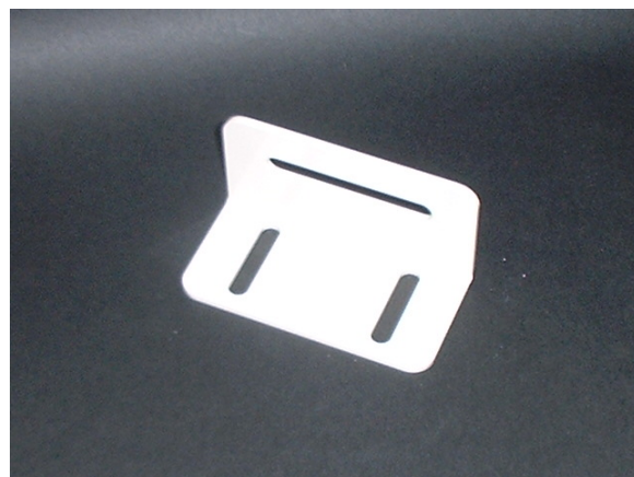
体幹パット受け金具（ショート型）

主に体幹部を支持するパットを取り付け、位置調整する部品です。 各種部品を取り付けて位置調整するのもにも便利に使用できます。 このたび板厚を2, 3mmに変更し、表面焼入れ処理をしました。 これにより、大幅な強度UPを図りました。